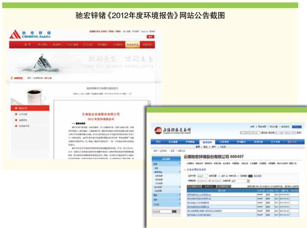
驰宏锌锗《2012年度环境报告》网站公告截图

2013年4月23日，在上海证券交易所网站和驰宏锌锗官网发布公告——《2012年度环境报告书》和《2012年度社会责任报告》。