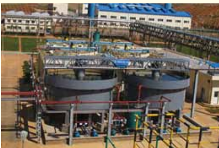
污酸污水预处理系统