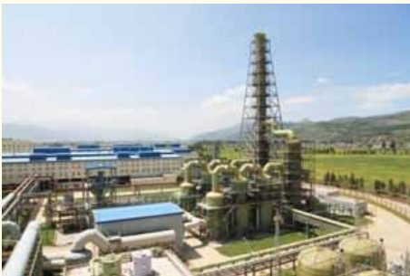
低浓度二氧化硫脱硫系统