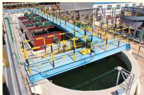
酸性废水处理系统